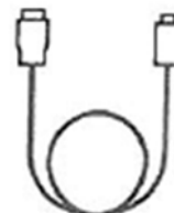
USB kábel (töltéshez)